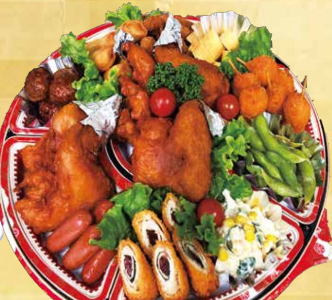
国産大手羽先オードブル 3,900円 (税込) (5人用 直径40cm)