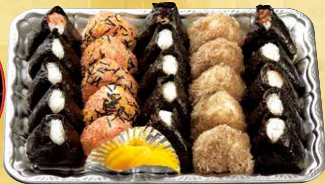
おにぎり詰め合わせ 2,300円 (税込) (25個 36×26cm)