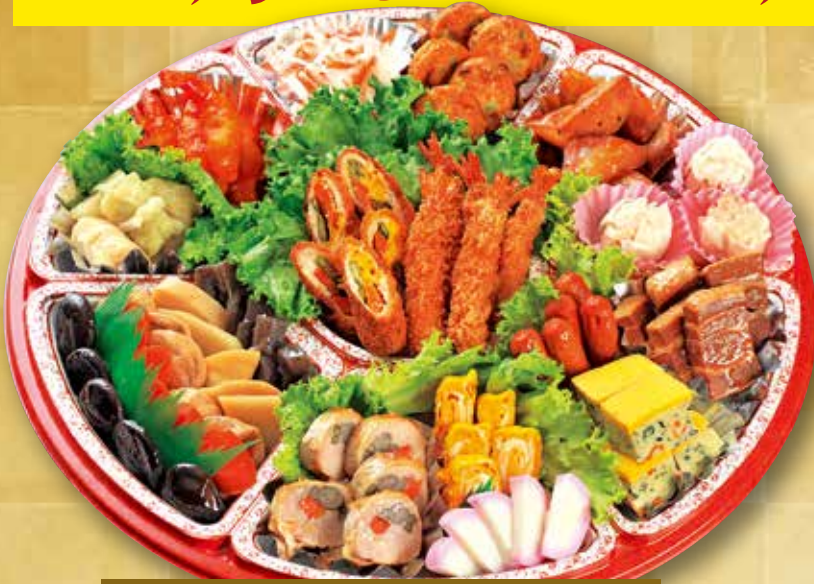
オードブルA 5,000円 (税込) 5,6人用 直径45cm