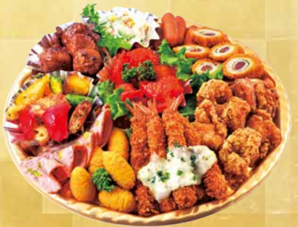
パーティオードブル 2,800円 (税込) (4~5人用 直径38cm)