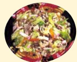
皿うどん (4.5人用) 2,500円 (税込) も好評販売中!