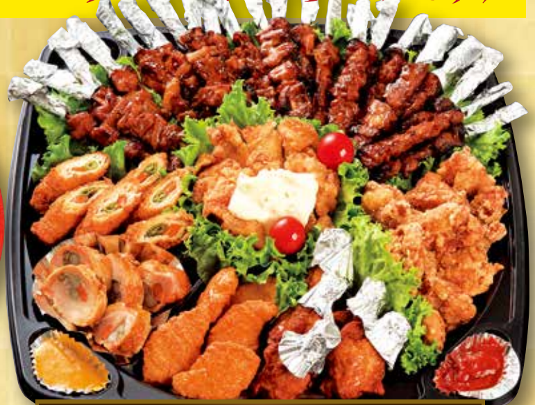
チキンオードブル 4,300円 (税込) 5,6人用 39×39cm