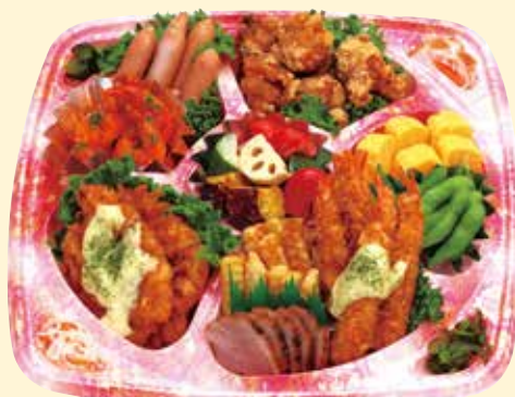
店舗オリジナルオードブル 2,800円 (税込) (5人用 直径37cm)

公会堂前店 828-3230 浜口店 845-6250 小ヶ倉店 879-5539 麹屋店 824-3277