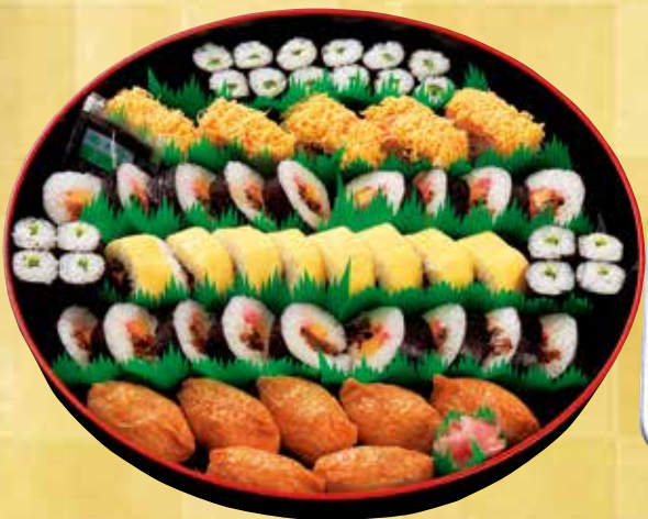
助六詰め合わせ 3,300円 (税込) (10人用 直径40cm)