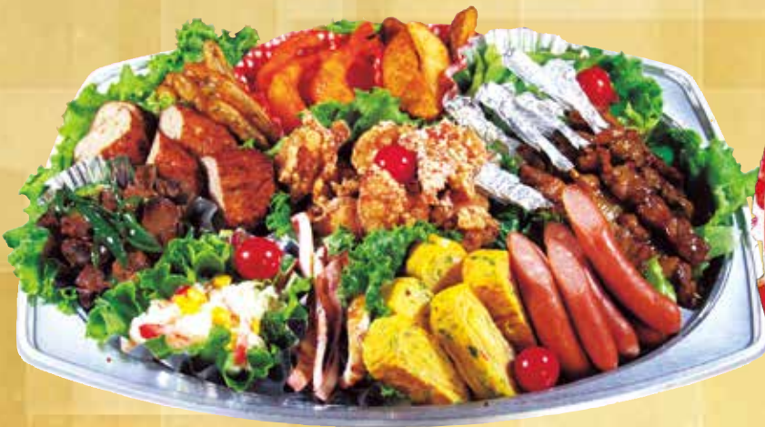
おつまみオードブル 4,300円 (税込) (5,6人用 44×33cm)